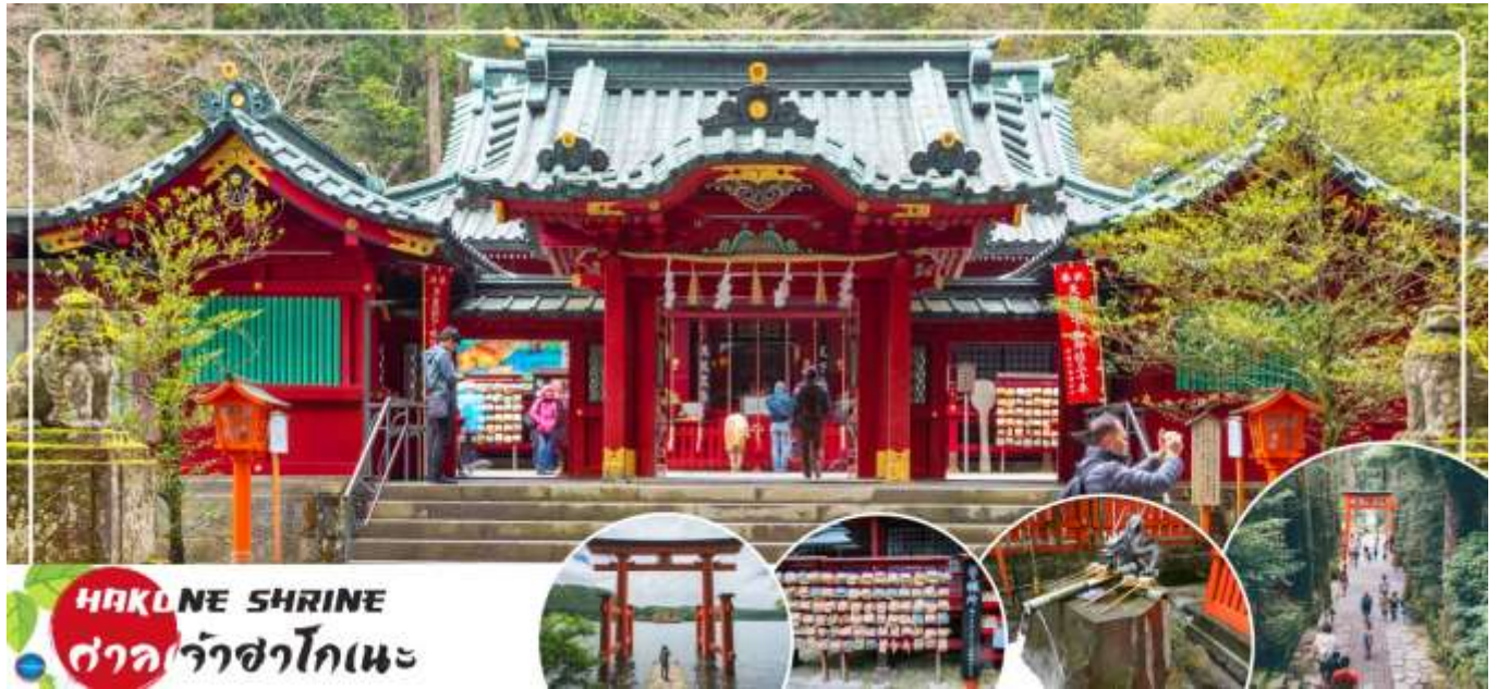
HAKONE SHRINE ศาลเจ้าฮาโกเนะ

ได้เวลาอันสมควรนำท่านเดินทางสู่ จังหวัดยามานาชิ (Yamanashi) (ใช้เวลาเดินทางประมาณ 2 ชั่วโมง ) เป็นจังหวัดที่ตั้งอยู่ในภูมิภาคชูบุของญี่ปุ่น เป็นที่รู้จักจากทัศนียภาพทางธรรมชาติที่สวยงาม รวมถึงภูเขาไฟฟูจิอันโดดเด่น ซึ่งตั้งอยู่บนพรมแดนระหว่างจังหวัดยามานาชิ และชิซุโอกะ